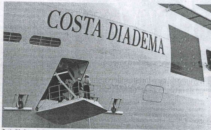
Costa Diadema, l'ultima nave varata dalla compagnia genovese