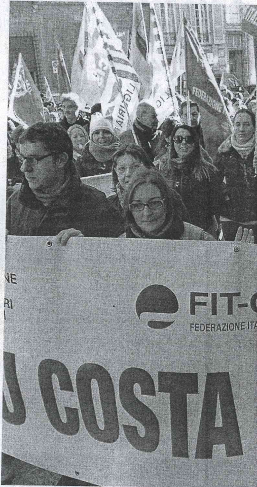
La protesta dei lavoratori di Costa Crociere

Ma c'è un secondo livello, che è quello del coinvolgimento del governo. Dopo le telefonate tra Luigi Merlo, presidente del porto, e il ministro dei Trasporti Maurizio Lupi da una parte e quelle, dall'al-